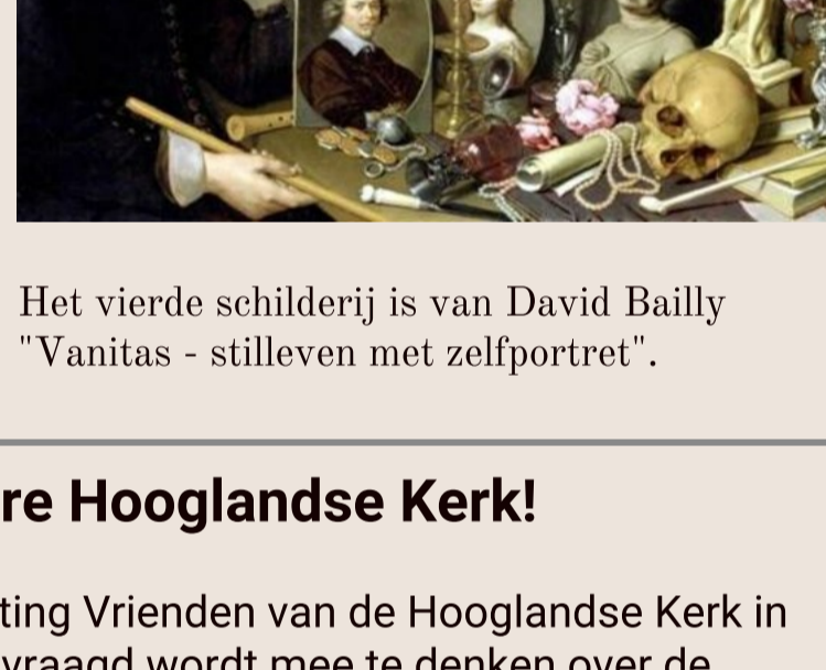
Het vierde schilderij is van David Bailly "Vanitas - stilleven met zelfportret".