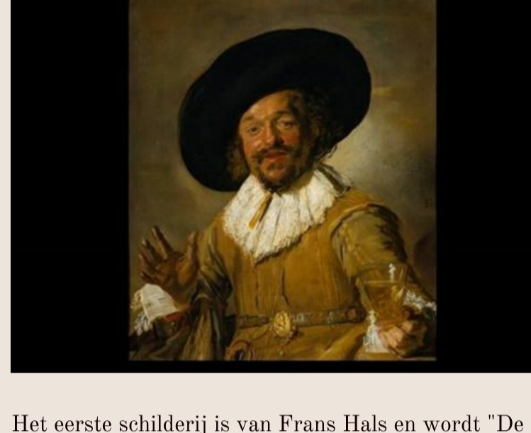
Het eerste schilderij is van Frans Hals en wordt "De vrolijke drinker" genoemd. De officiële titel is "Een schutter die een berkenmeier vasthoudt".

Het doek van de Haarlemse schilder Frans Hals toont "De vrolijke drinker", een man die met een glas drank in de hand uitnodigend de wereld in kijkt.