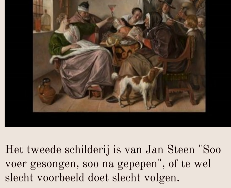
Het tweede schilderij is van Jan Steen "Soo voer gesongen, soo na gepepen", of te wel slecht voorbeeld doet slecht volgen.