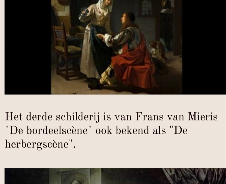
Het derde schilderij is van Frans van Mieris "De bordeelseène" ook bekend als "De herbergseène".