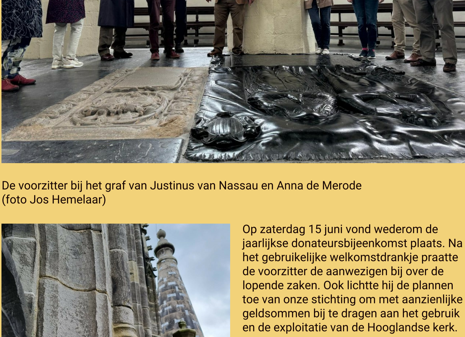
De voorzitter bij het graf van Justinus van Nassau en Anna de Merode