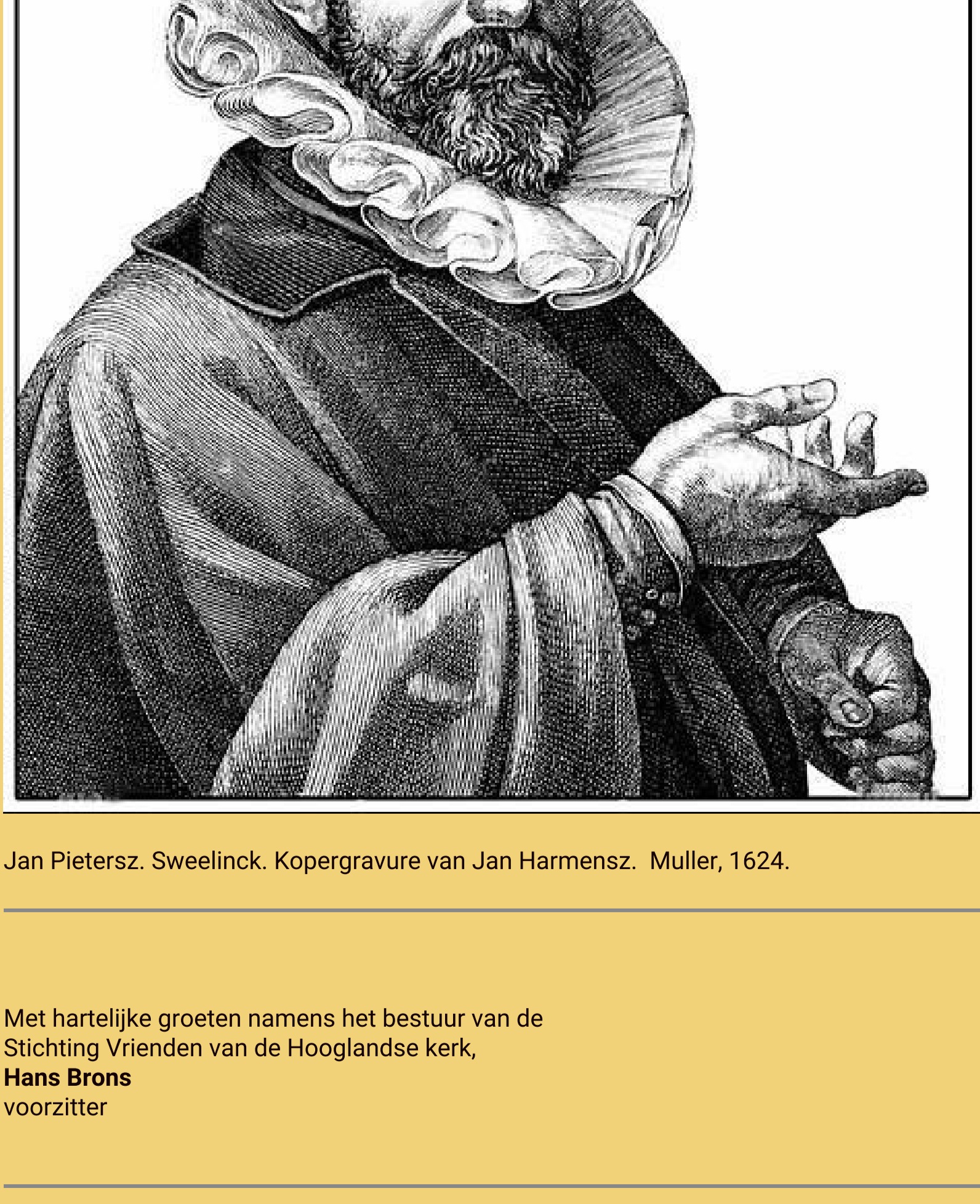
Jan Pietersz. Sweelinck. Kopergravure van Jan Harmensz. Muller, 1624.