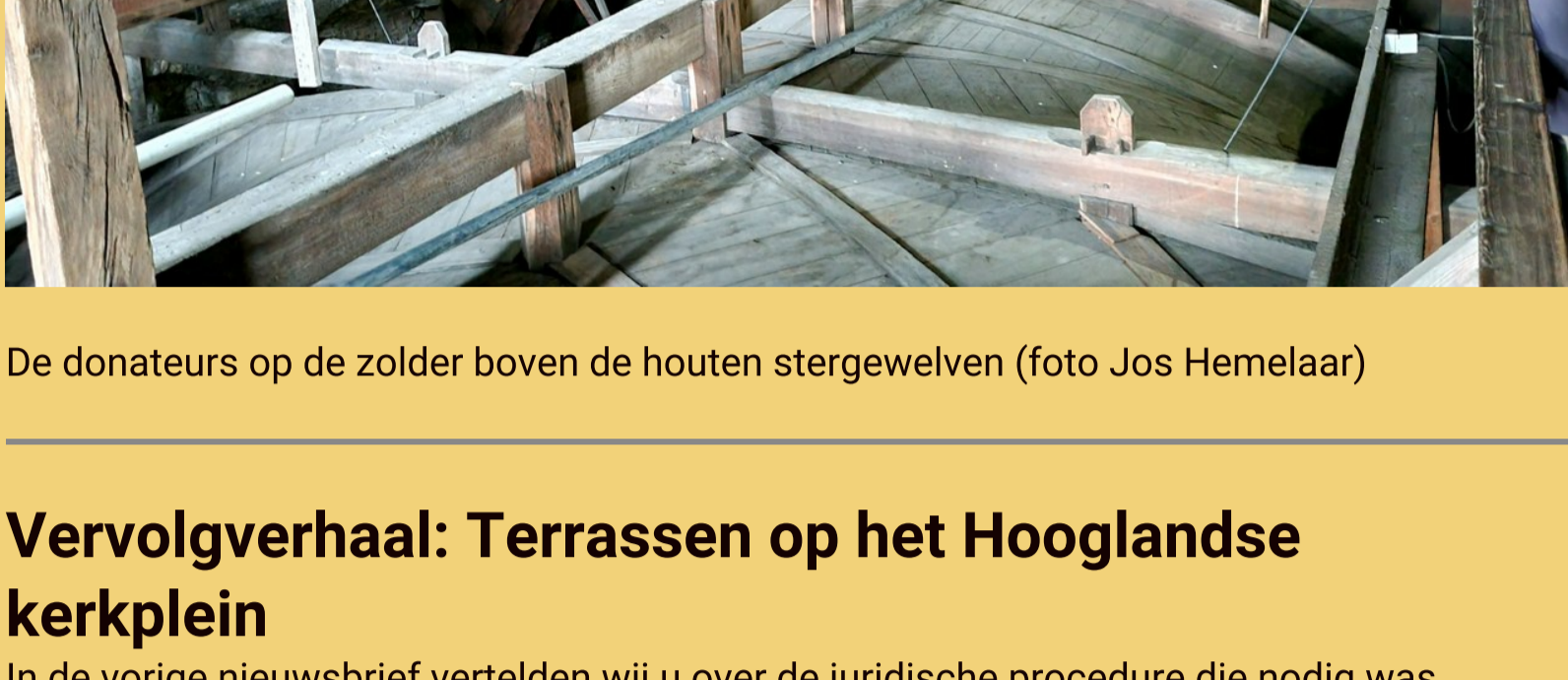
De donateurs op de zolder boven de houten stergewelven

Daarna volgde een rondleiding door de kerk en zochten wij het hogere van de stenen wenteltrappen naar de balustrade van het zuidertransept. Via de zolders met de nog geheel intacte kapconstructie uit omstreeks 1500 ging het naar de balustrade van het noordertransept, waar het uitzicht over de stad bewonderd werd. Stoffig maar voldaan keerde iedereen terug om nog een hapje en een drankje te nuttigen