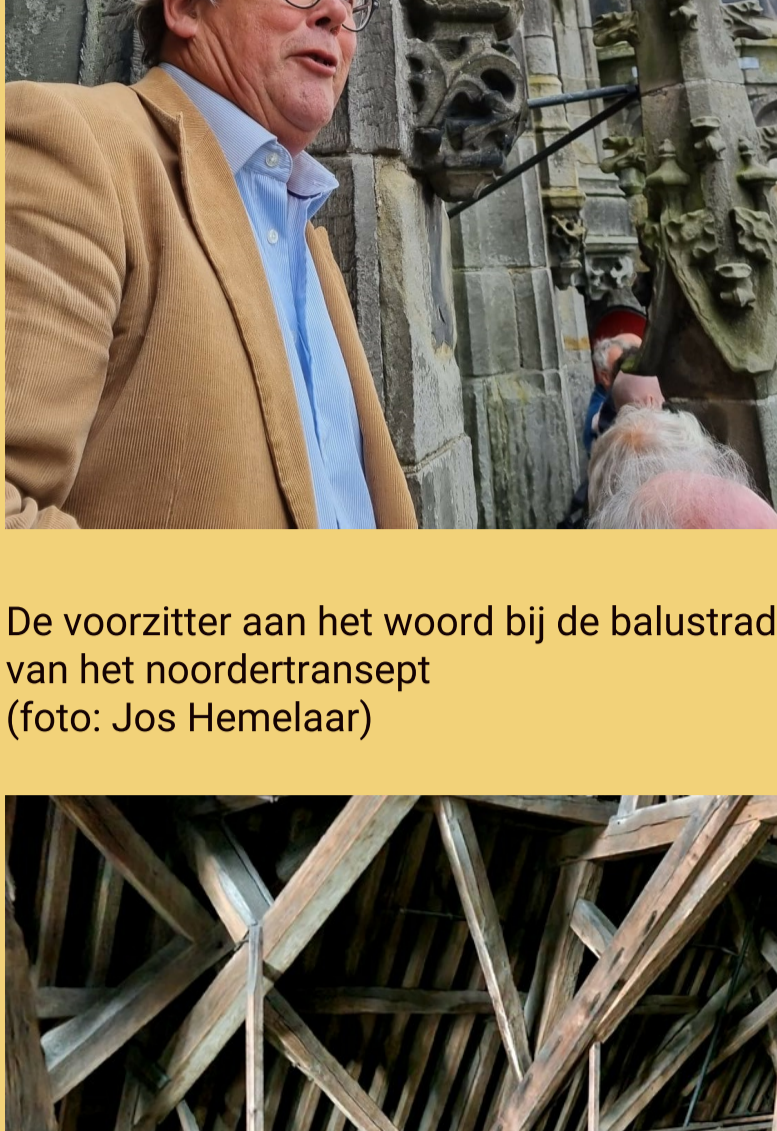
De voorzitter aan het woord bij de balustrade van het noordertransept

Op zaterdag 15 juni vond wederom de jaarlijkse donateursbijeenkomst plaats. Na het gebruikelijke welkomstdrankje praatte de voorzitter de aanwezigen bij over de lopende zaken. Ook lichtte hij de plannen toe van onze stichting om met aanzienlijke geldsommen bij te dragen aan het gebruik en de exploitatie van de Hooglandse kerk.