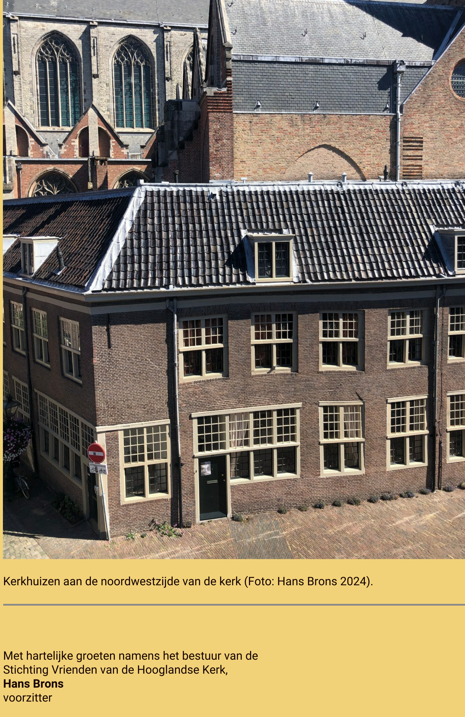
Kerkhuizen aan de noordwestzijde van de kerk.

Ook dit keer ontvangt u een extra nieuwsbrief geschreven door onze voorzitter Hans Brons: De geschiedenis van de kerkhuizen rond de Hooglandse Kerk. Sinds het einde van de 16de eeuw zijn er kerkhuizen rond en tegen de Hooglandse Kerk gebouwd.