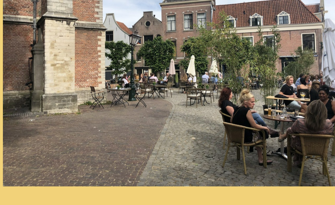
Terrassen op het Hooglandse Kerkplein tijdens corona

Afgelopen zomer werd de kerk geconfronteerd met een plan van wethouder Spijker in samenspraak met horecaondernemers aan het plein van de Hooglandse Kerk. Het idee was om het plein te gaan inrichten als terras. Dat plan vormt voor de kerk een probleem. Tijdens de coronapandemie is het plein voor de kerk tijdelijk ook gebruik geweest als terras. Maar dat was in een periode dat iedereen even inschikkelijk opschoof voor elkaar, om elkaar te helpen. Bovendien werd in die periode de kerk zelf veel minder intensief gebruikt. Er was toen grote behoefte aan een ontmoetingsplek, en de bestaande terrassen waren niet geschikt. Met de tijdelijke ruimte op het plein kwamen er niet méér cafébezoekers; ze konden alleen verder uit elkaar zitten. Toen de coronamaatregelen werden afgeschaft, verdween het tijdelijke terras weer.