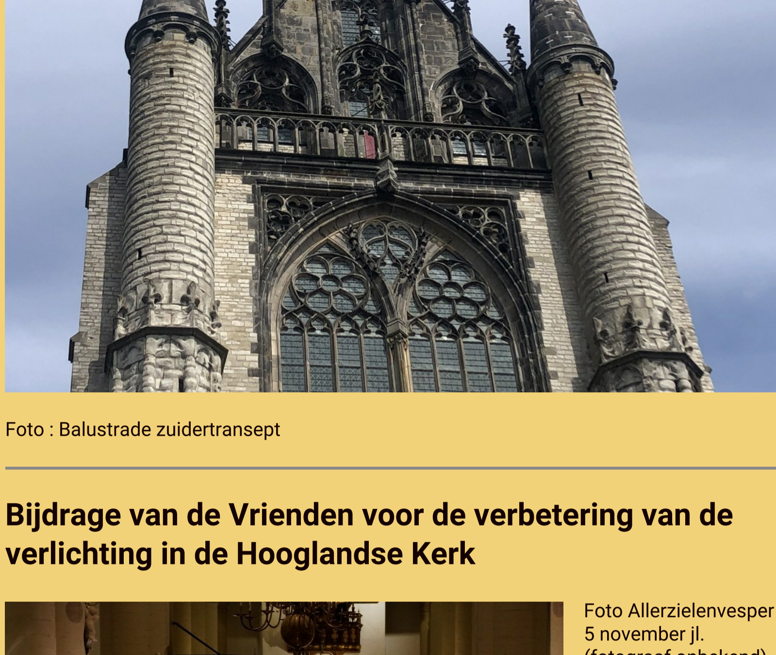
Foto : Balustrade zuidertransept

Op 15 juni aanstaande wordt weer de jaarlijkse donateursbijeenkomst gehouden. Zoals gebruikelijk heten wij u en uw eventuele introducees dan met een sprankelend glas welkom. De voorzitter zal u kort bijpraten over de recente ontwikkelingen en de plannen voor de toekomst. Daarna geeft hij een rondleiding door de kerk. Voor de liefhebbers voert deze ook over de zolders van de kerk en de balustraden hoog boven de noorder- en zuidertranseptgevels. Spectaculair daarbij is de nog originele kapconstructie uit het einde van de 15 de eeuw en het uitzicht vanaf de balustraden over de binnenstad van Leiden. Tot circa 18 uur is er verder nog gelegenheid tot ontmoeting onder het genot van een hapje en een drankje.